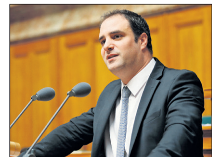
Michaël Buffat se réjouit du basculement à droite du Conseil d'Etat.

Frédéric Borloz, PLR 7209 voix, 60,3% / Isabelle Moret, PLR, 7206 voix, 60,27% Valérie Dittli, Le Centre 6519 voix, 54,52% / Michaël Buffat, UDC, 6244 voix, 52,22% Nuria Gorrite, PSV, 6196 voix, 51,82% / Rebecca Ruiz, PSV, 8'014 voix, 50,3% Vassilis Venizelos, Les Verts, 5007 voix, 41,88% / Cesla Amarelle, PSV, 4647 voix, 38,87%